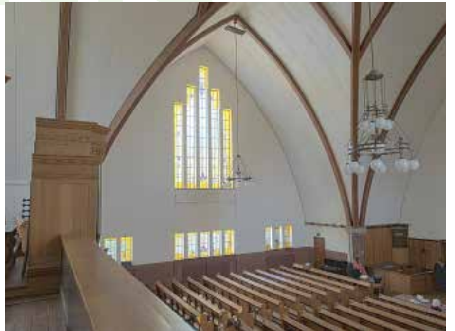
Interieur Nieuwe Kerk te Ede