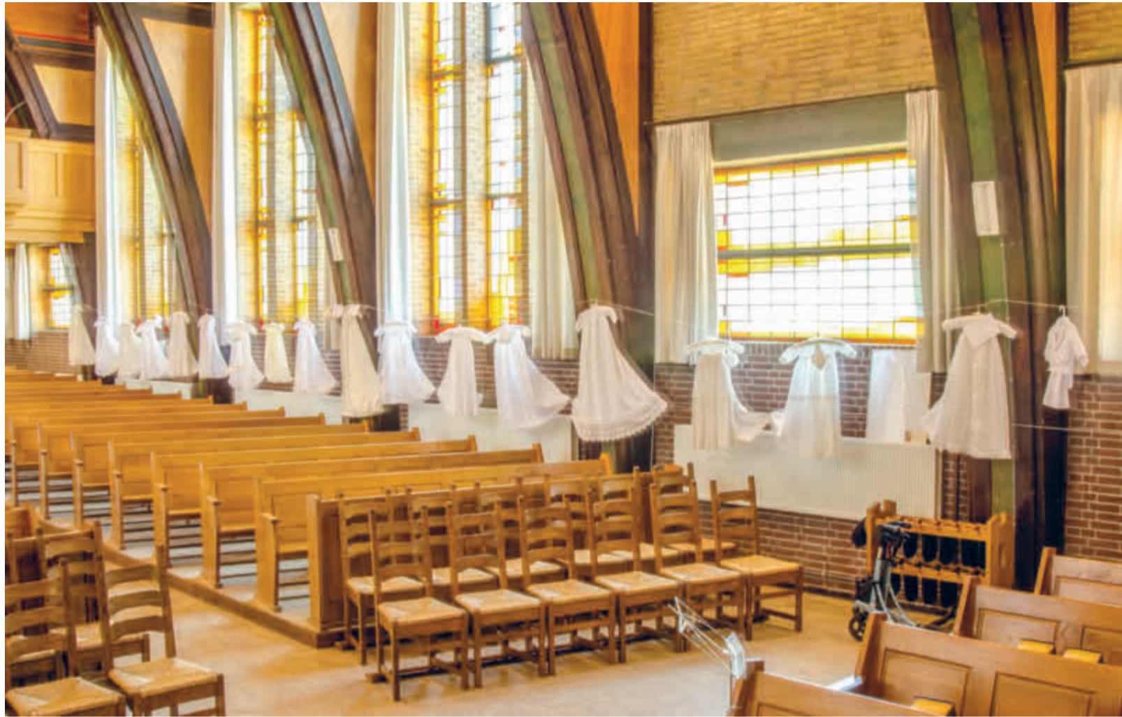
Doopjurkjes die door gemeenteleden waren ingeleverd.

REPORTAGE Veel Scheveningse families en ook het predikantsgezin van 90 jaar geleden zijn er niet aan ontkomen: het noodlot met de dood als gevolg. Des te dankbaarder zijn ze voor iedere dag. De Prinses Julianakerk viert feest.