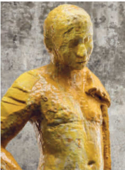
'The Boy', sculptuur en foto van Johan Creten.

Aan het strand van Scheveningen als het warm is - zeg maar: heet - dan gebeuren nare dingen: zwaar geval van dierenleed. Honden in de hete auto dat vindt niemand in de haak, maar met uilen op de foto is onschuldig volksvermaak? Nergens schaduw om te schuilen. Dorstig, uitgedroogd en moe. Houdt u van gebraden uilen? Ga naar Scheveningen toe. Nee, met dierenlevens spelen is geen koosjer volksvermaak. Mocht u zich nogal vervelen, ga dan naar een speelgoedzaak.