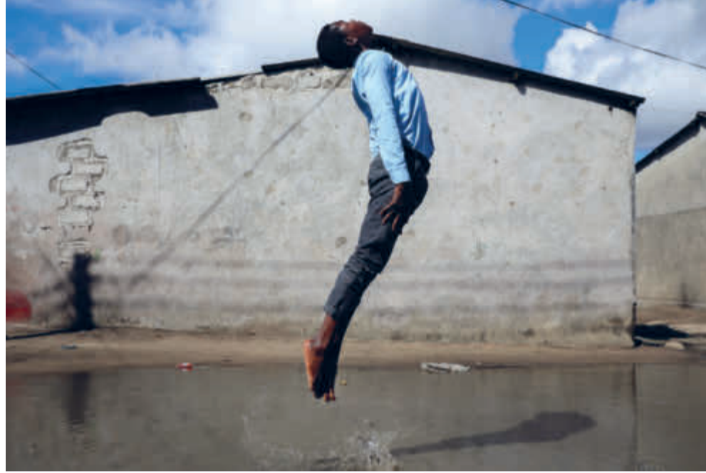
Opstijgen naar beter leven.