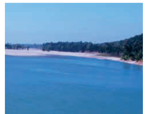
De Karnali-rivier in Nepal.