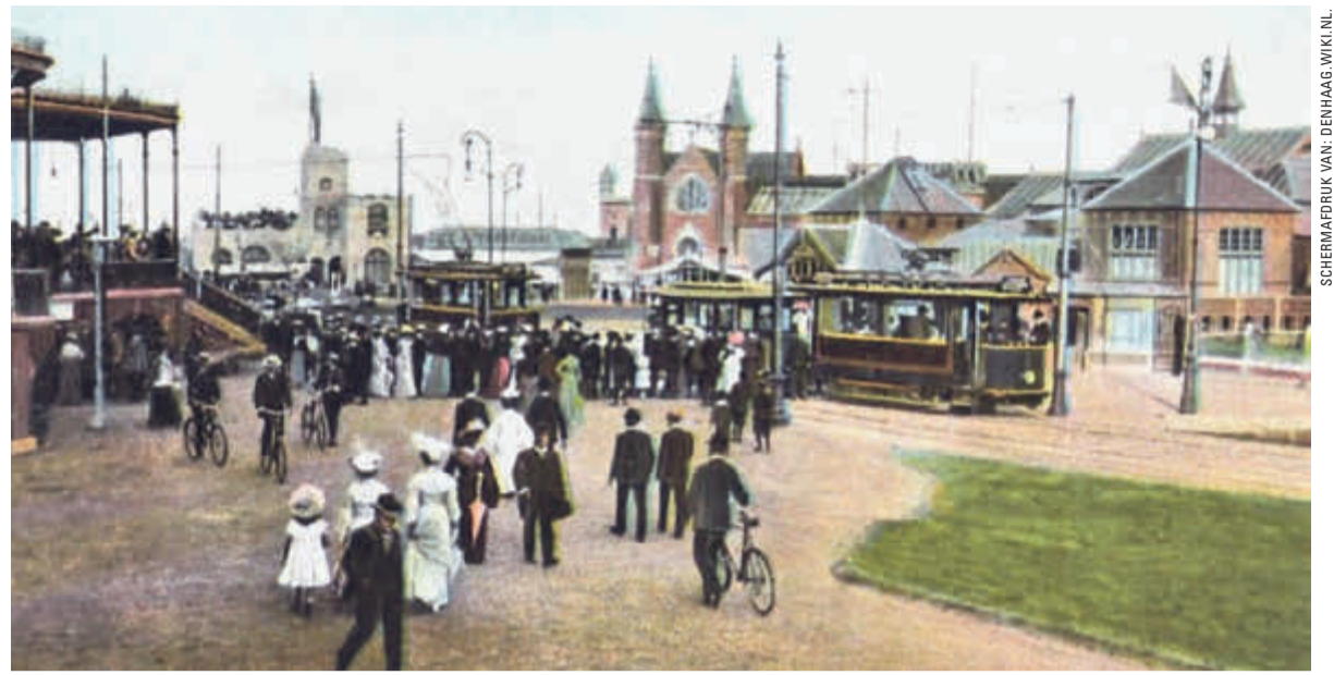
Toeristen stappen uit de tram aan het Gevers Deynootplein, vlakbij de Badkapel (1904) die herkenbaar is aan de twee torentjes.

Haagse nieuws: de hofberichten vermeldden steevast wanneer koningin Wilhelmina en haar gevolg ter kerke waren geweest en onder wiens gehoor.