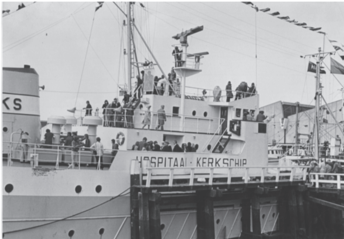
Hospitaal-kerkschip De Hoop, afgemeerd in Scheveningen in 1975.

ACHTERGROND Een kerk die jaarlijks 23.000 mijl aflegt op volle zee om dichtbij de gelovige vissers te zijn. Het lijkt een ongelooflijk verhaal, maar het is de geschiedenis van hospitaal-kerkschip De Hoop. Dertig jaar geleden gestopt, maar nog niet vergeten.